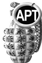
Anton Podbevšek Teater