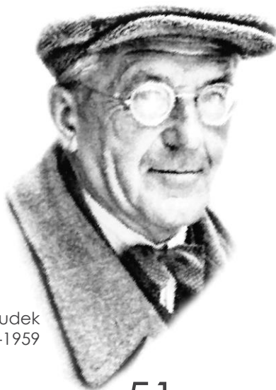
Stanko Bloudek 1890 - 1959

ODBOR ZA PODELJEVANJE BLOUDKOVIH PRIZNANJ