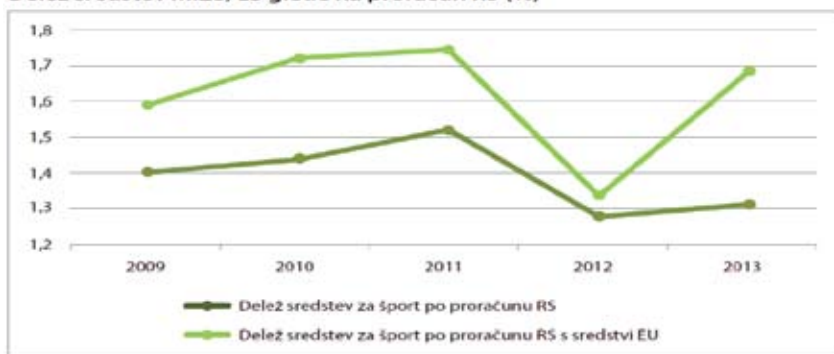
Slika 2: Delež sredstev MIZŠ glede na proračun RS.

'šport' vseh dejavnikov športa v Sloveniji preko takratne ZTKS.