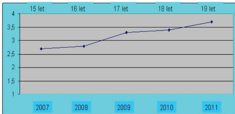
Slika 2: Razvojna pot reducirane potencialne tekmovalne uspešnosti RPTU med 15 in 19 letom.